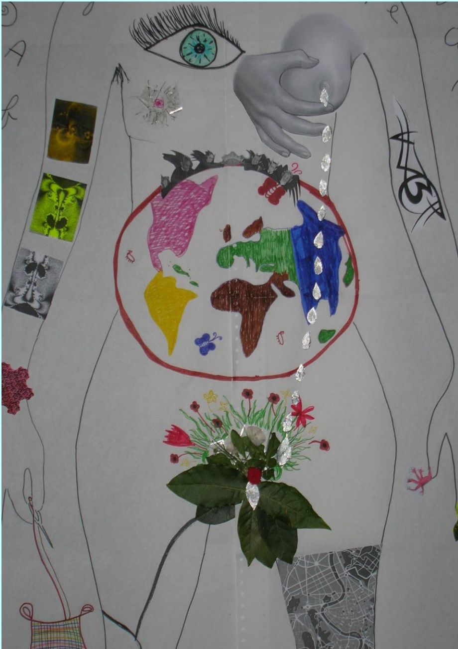
Gender and Globalization: Detail